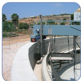
Sistema di rimozione schiume e spazzolatore motorizzato (OPZIONE)