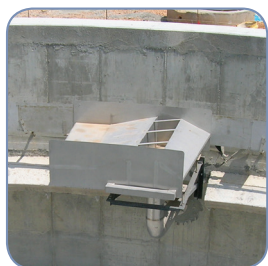
Scum Box (OPTION)